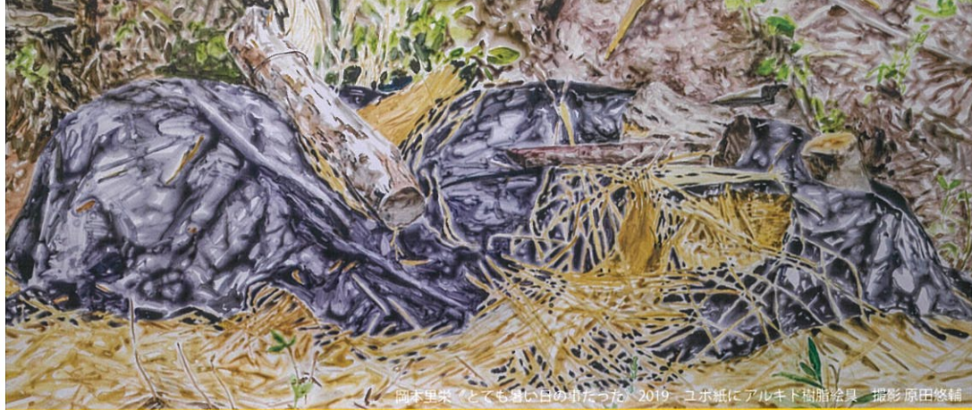
岡本里栄 くとも楽しい日めつたつた。2019。ユホ紙にアルキト樹脂絵具。撮影 原田修輔